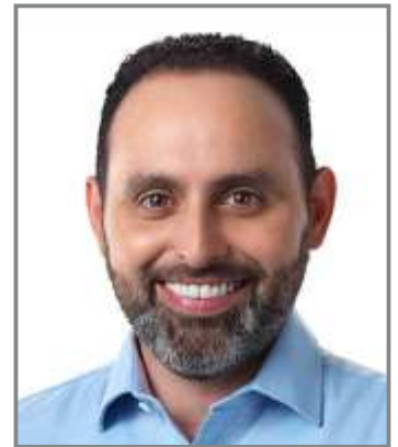
Deputado Ulysses Gomes Líder do Bloco Democracia e Luta